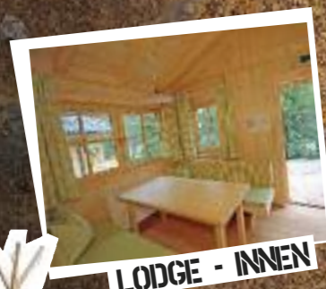
LODGE - INNEN

Das Gelände rund um die AREA 47 ist ein Naturschutzgebiet. Übernachtungsgäste müssen sich daher an unsere Hausordnung halten