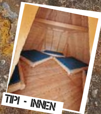
TIPI - INNEN